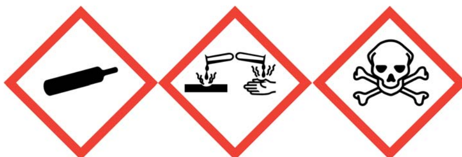
Gassen onder druk