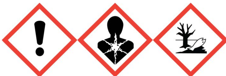
Irriterend, sensibiliserend, schadelijk