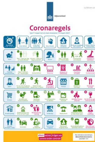
Overzicht wijziging maatregelen per 3 maart 2021

De overheid heeft op 2 en 23 februari jl. in haar persmomenten aanvullende en nieuwe maatregelen afgekondigd waaronder een verlenging van de lockdown tot en met 15 maart 2021 (zie onder) en de avondklok. Voor de achterban van de partners van de corona-helpdesk is de beperkte openstelling van winkels en showrooms voor particulieren (B to C) de belangrijkste positieve ontwikkeling.